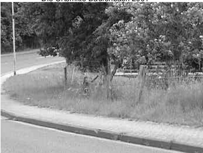
Die Ortsmitte Daufenbach 2001